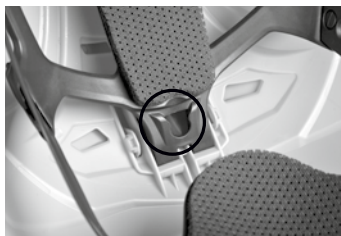
Zásuvný knofl ík vzadu